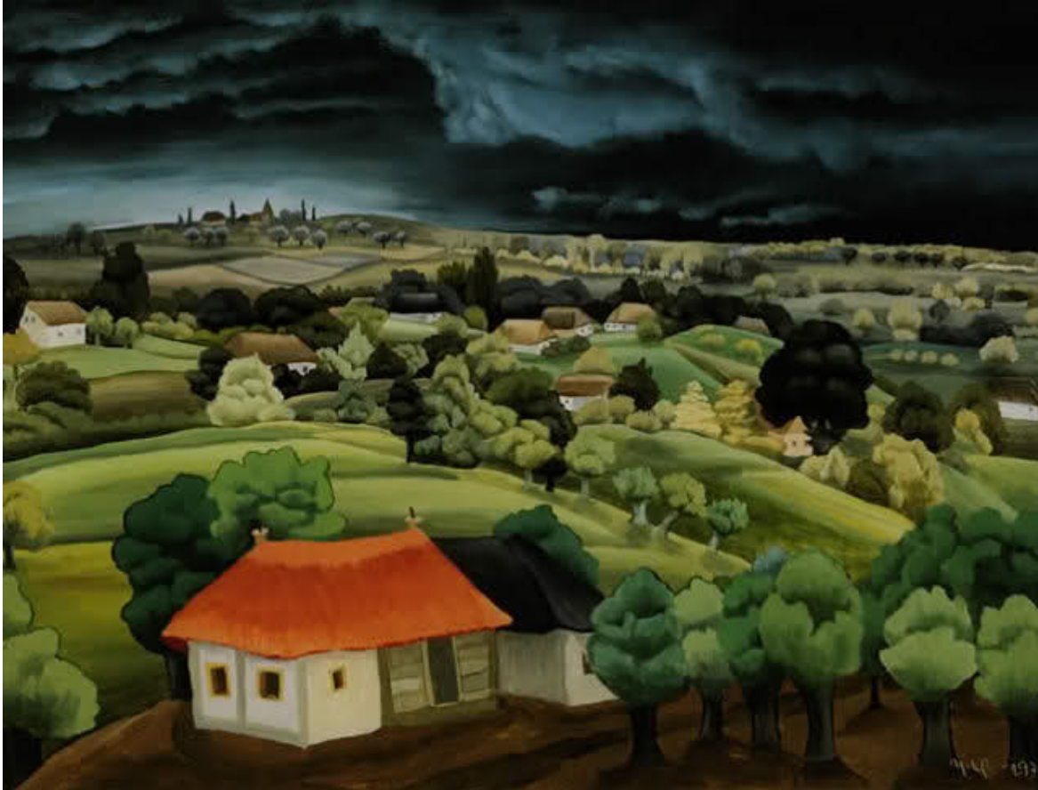
Ivan Generalić - Paesaggio nella tempesta (1939)