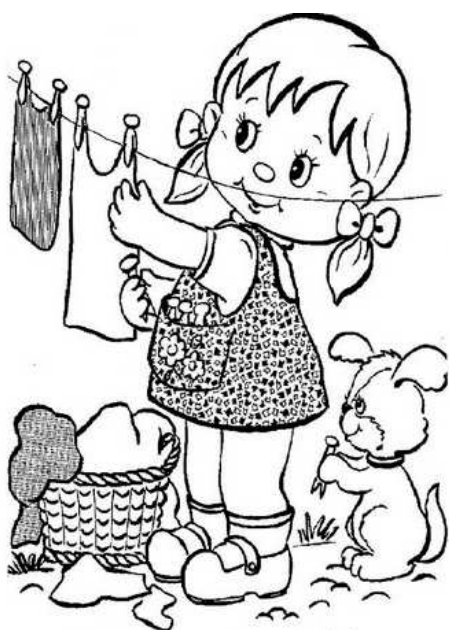
LA BELLA LAVANDERINA