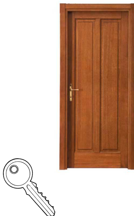
APRI LA PORTICINA