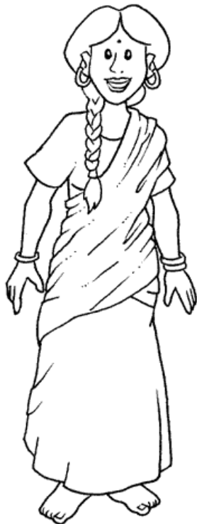
Il sari indiano